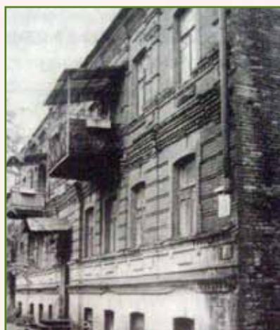
בית משפחת רב העיר ביקטרינוסלב - בבית זה גדל הרבי

במשך תקופה זו, התפרסם ר' לוי"צ בזכות גאונותו העצומה, והשתתף בכל האסיפות בעניני הכלל אותם כינס הרבי הרש"ב.