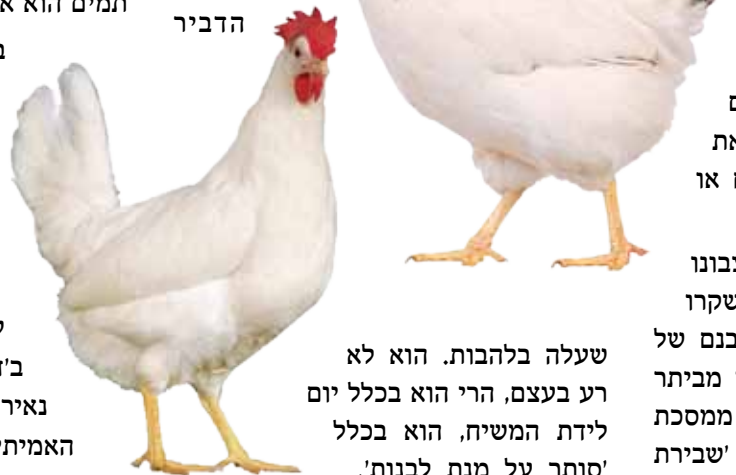
שעלה בלהבות. הוא לא רע בעצם, הרי הוא בכלל יום לידת המשיח, הוא בכלל 'סותר על מנת לבנות'.

אך תשעה-באב, הוא יום אבל ויגון רק בגלל המאורעות שקרו בו, בגלל ה'ערב רב' שרצה לחזור בתרנגולת והתרנגולת ב ג ל ל שחרבו את טור מ ל כ א , ב ג ל ל הדביר