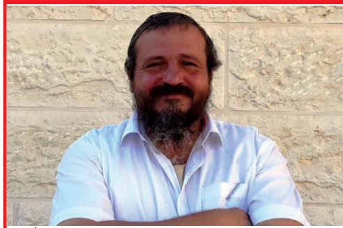
ברכת יישר כח! השדרן אוויר רווח הביא בשידור חי את דבריו של הרבי שליט"א מלך המשיח, אך מנהלי הערוץ החליטו לנזוף בו על כך...