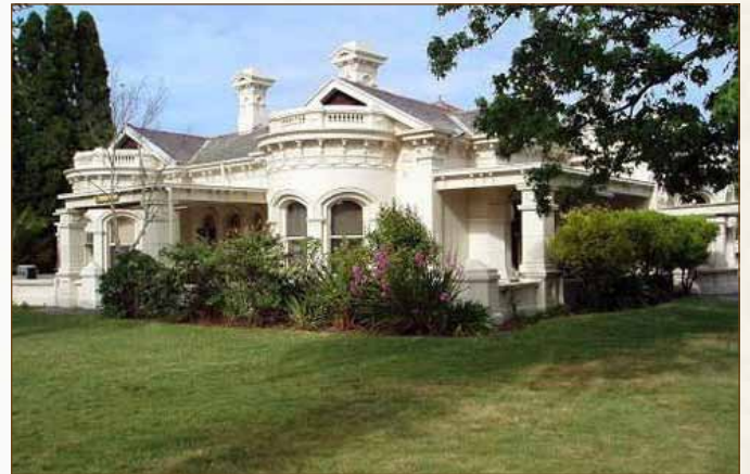
בנין הישיבה במלבורן

באותו יום דיווח הרב גוטניק לרבי על קניית הבנין, ועל כך שנרשם על שם הרבי, הרבי הגיב על כך בטלפון בחיוך רחב: