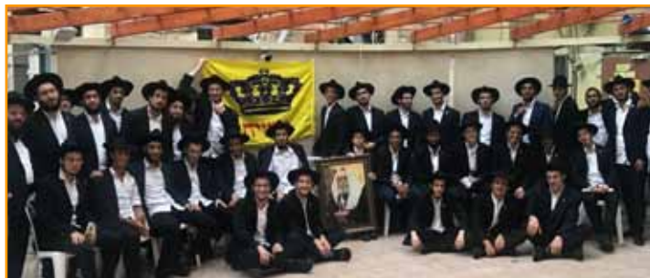
התמימים מפעילי מועדוניות השל"ה ברחבי הארץ בתמונה קבוצתית

והנה קמו קבוצה של תמימים שסרבו לציית לנורמות המקובלות בשנים האחרונות לפיהן טובי בחורינו מקבלים תפקידים בכירים יותר או פחות בצמרת