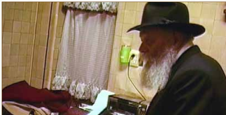
קופת הצדקה הקבועה במטבח בביתו של הרבי מלך המשיח שליט"א

בעוד שיחה זו נאמרה אך ורק בפני הנשים, חזר