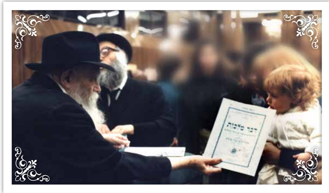
ט"ו אייר תש"א. 25 שנה לחלוקת הדבר מלכות