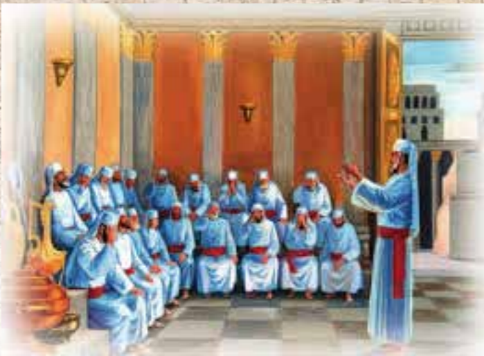
ציור לשכת הגזית באר"י בית מכוון המקדש

הגדול 18 , סנהדרין קטנה לכל שבט ושבט ולכל עיר ועיר, ובהסכמתם יוצאים למלחמת הרשות 19 .